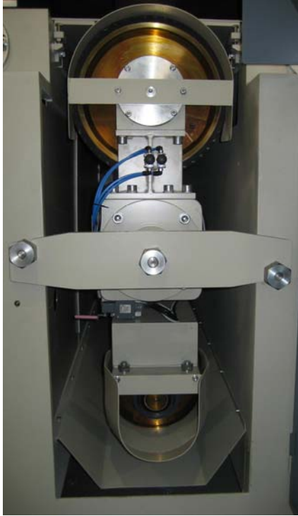
VISTA GRUPO DE CONTACTO